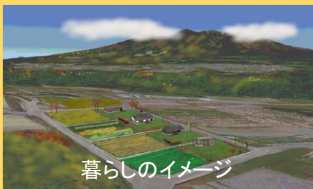
暮らしのイメージ

13:00頃 集落散策(地元コンシェルジュがご案内:約2時間) ⇒ 15:30頃 [宿泊]「スパティオ小淵沢」 19:30頃 星空観察、シカ探索、温泉などお楽しみ下さい ⇒ [夕食]LO21:30まで